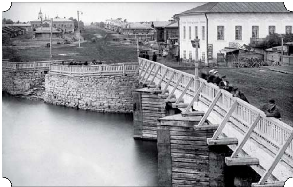
Старый деревянный мост через Миасс и продолжение его Екатеринбургская улица

Челябинская крепость, как известно, была построена в 1736 году на правом берегу реки Миасс. С левым берегом реки её соединял построенный тогда же первый мост, который располагался в том же месте, где и современный Кировский (Троицкий) мост. Историки отмечают особую важность моста, имея в виду то, что за ним, на север шла дорога, которая вела в соседний Екатеринбург. Именно там размещалось Правление Сибирских и Казанских заводов. По этой же дороге можно было добраться и до Уфы, где до 1744 года находилось руководство Оренбургской экспедиции, впоследствии — гражданские власти Оренбургской губернии. Из Челябинска в Уфу ездили кружным путем вплоть до последней трети XVIII века.