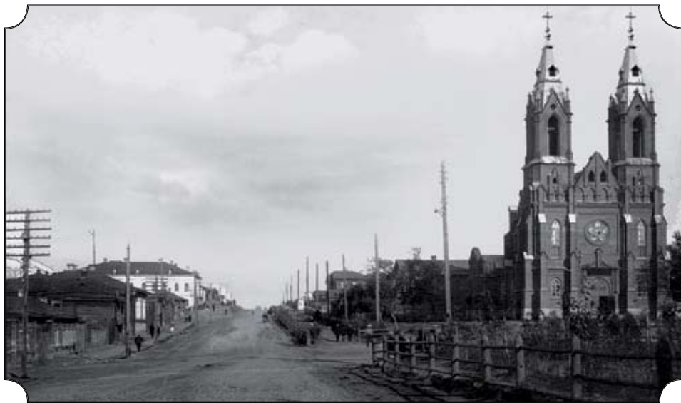
Костел Челябинск. Улица Спартака (ныне проспект Ленина). Справа костел.