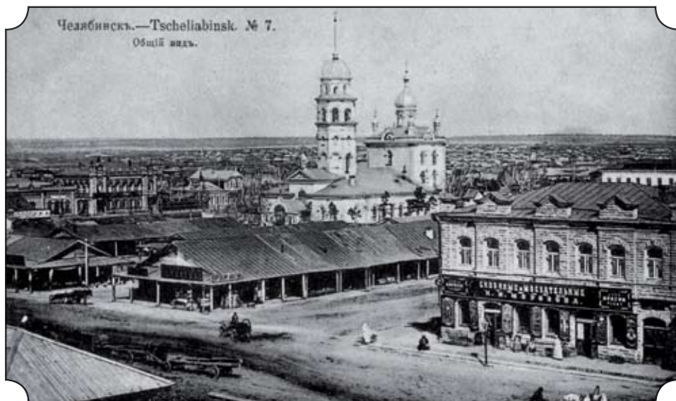
Челябинск.—Tschellabinsk. № 7. Общій видъ.

Христорождественский собор. Вид на Христорождественский собор со стороны улицы Уфимской (ныне Кирова)