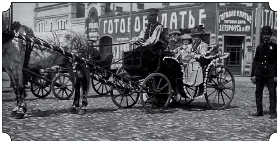
Челябинск. Городской дилижанс.