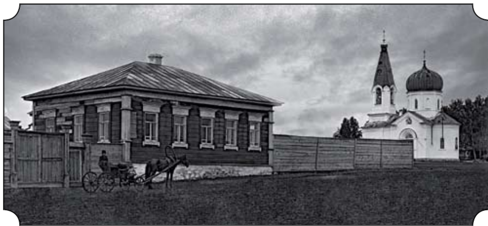
Симеоновская церковь в Заречной части города.

ной дороги, открыто движение до станции Челябинск. Строительство Транссиба — крупнейшее в мире железной дороги, соединяющей Челябинск и Владивосток.