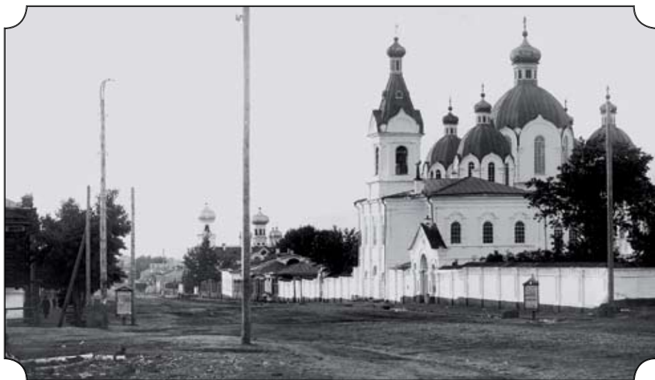
Челябинск. Одигитриевский монастырь. На этом месте сегодня стоит гостиница «Южный Урал»