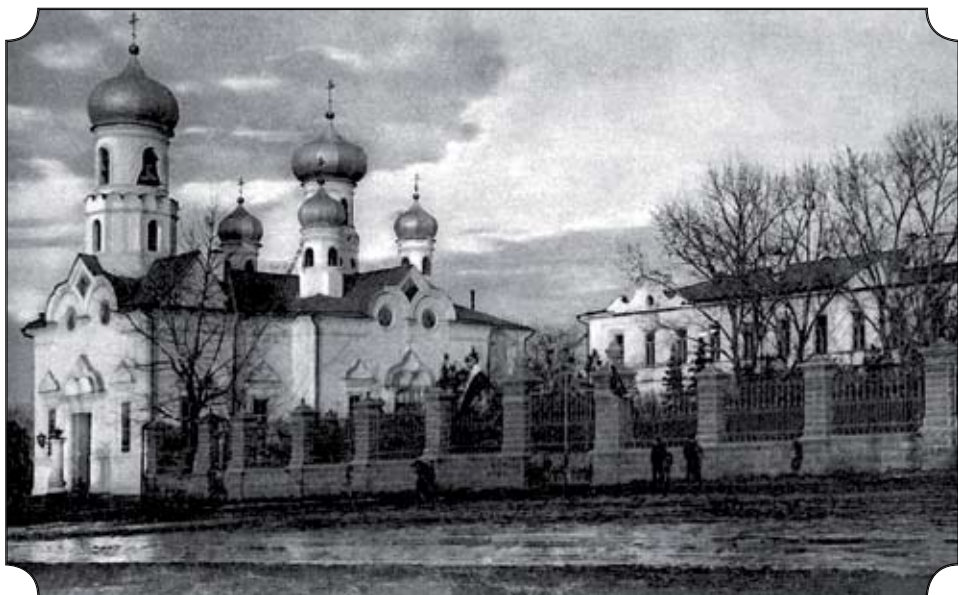
Челябинск. Духовное училище. Его усадьба занимала полквартала между Южным бульваром (ныне проспект Ленина) и улицей Степной (ныне улица Коммуны). Сегодня здесь располагается комплекс зданий администрации Челябинской области