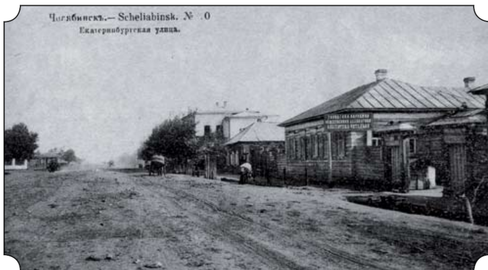
Челябинск. Екатеринбургская улица (ныне северная часть улицы Кирова)

Уфимское наместничество преобразовано в Оренбургскую