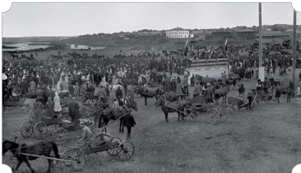
Заречье. Сенная (Хлебная) площадь. Ныне площадь у кинотеатра «Родина».

Организация народных училищ в губернских и уездных городах Урала. Государственная система народного образования начала развиваться в конце XVIII века во время царствования Екатерины II. В 1782 году была создана правительственная «Комиссия по учреждению училищ», разработавшая первый школьный устав. В нём определялось, какие создавать школы и чему в них обучать. Комиссия составила и издала учебники и пособия, подготовила кадры учителей для первых открываемых школ. В числе первых таких училищ, созданных на основании устава 1786 года, было и училище в Челябинске, открытое 29 июля 1786 года. Оно принадлежало к разряду малых народных училищ. Новое учебное заведение в уездном городе арендовало небольшой домик на одной из улиц (в районе Заречья). Однако просуществовало училище недолго из-за отсутствия денег.