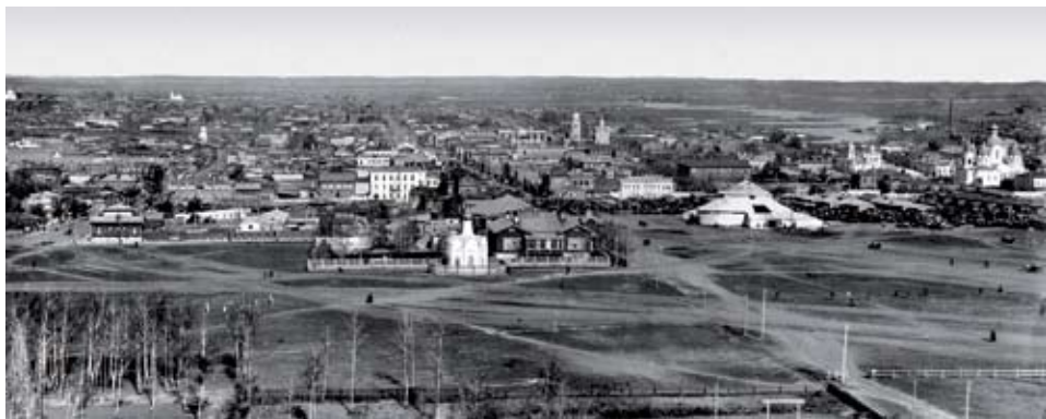
Панорама города Челябинска Челябинск. Вид с элеватора на Южную площадь (ныне площадь Революции). 1917 г.