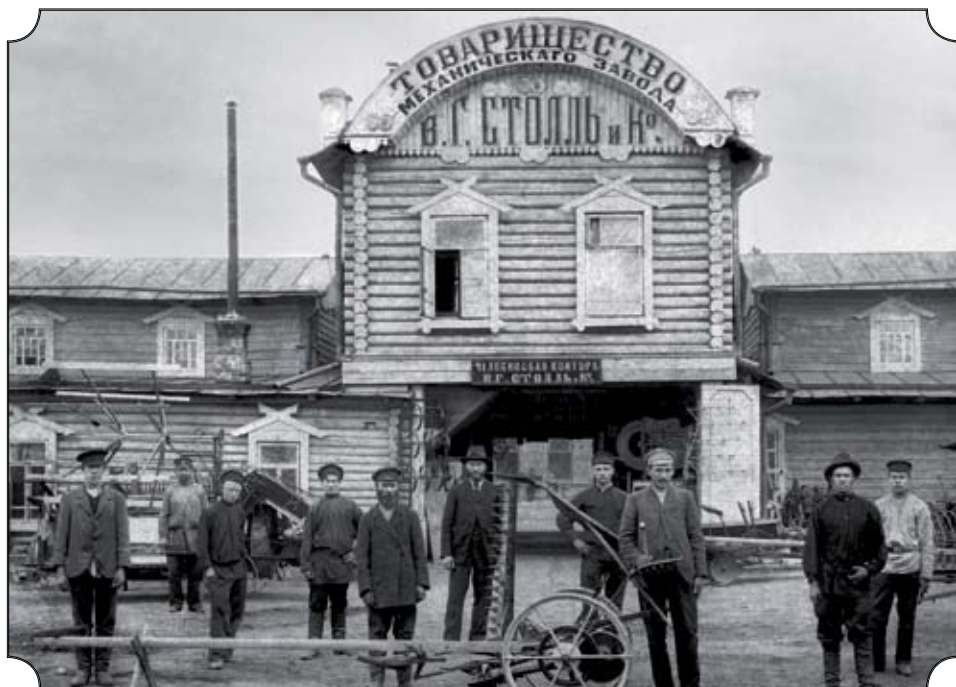
Челябинск. Контора товарищества механического завода Столь и К° (ныне завод имени Колущенко)

Кокорев и К°». Ныне в этом здании размещается трамвайно-троллейбусное управление.